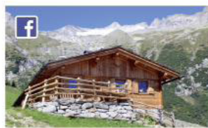
Familienalm - Posto di ristoro Rußbachalm Tel. 348 4701828 - Tel. 340 9416487 www.russbach.it