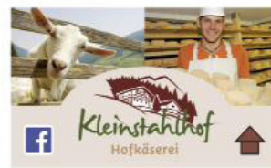
Hofkäseerei - Caseificio Kleinstahlhof Tel. 333 4860454 www.kleinstahl.com