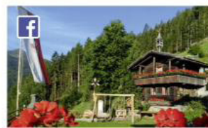
Panorama Jausenstation - Posto di ristoro Großstahlhof Tel. 0474 670094 - Tel. 340 4180063 www.grosstahlhof.com