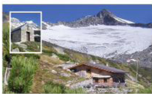
Jausenstation - Posto di ristoro Kegelgassl Tel. 348 8730731 www.kegelgassl.eu - webcam