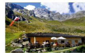
Jausenstation - Posto di ristoro Hollenzalm Tel. 347 5713156 - Tel. 0474 657061 www.unterberghof.net