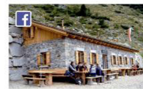
Jausenstation - Posto di ristoro Daimer Hütte - Malga Tel. 348 7248124 - Tel. 348 7230207 daimerhuette@gmail.com