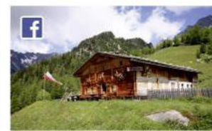
Almschank - Malga Holzerböden Tel. 349 7130859