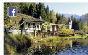
Jausenstation - Posto di ristoro Bizat-Hütte Tel. 349 3622039