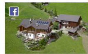
Hofschank - Osteria al maso Waldlechn Tel. 348 7636505 - Tel. 0474 652256 www.waldlechn.it