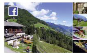
Jausenstation - Posto di ristoro Rotbachalm Tel. 348 9022048 - Tel. 340 4910831 www.rotbachalm.com