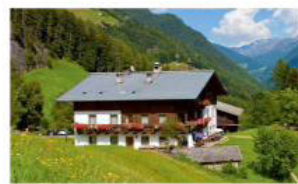
Berggasthof - Albergo di montagna Platterhof Tel. 0474 671255 www.platterhof.info