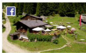
Jausenstation - Posto di ristoro Schwarzbachalm Tel. 391 3321903 www.schwarzbachalm.com